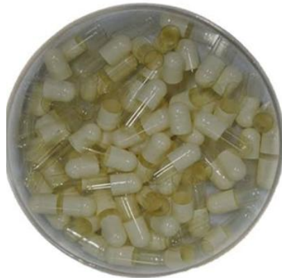
Gambar 4. Hasil Cangkang Kapsul Tulang Ikan Lele dengan Menggunakan Formula II