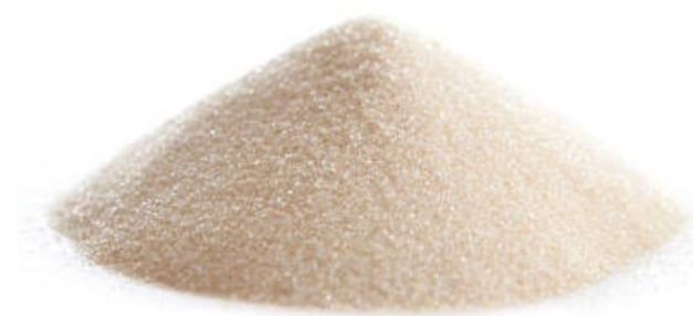
Gambar 1. Hasil Serbuk Gelatin Ikan Lele